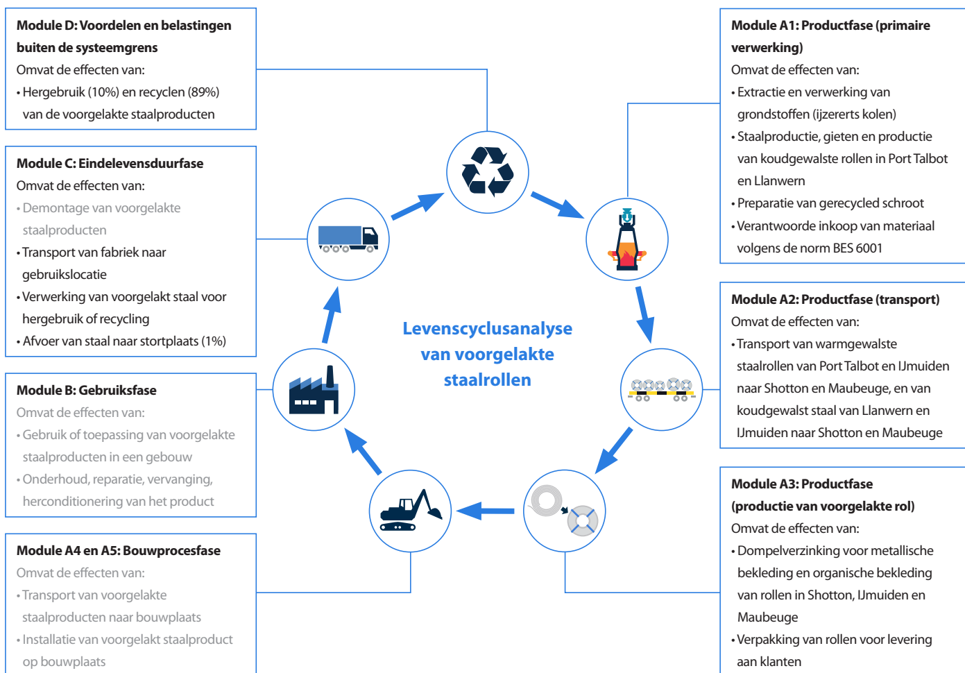
Afbeelding 2 Levenscyclusanalyse van voorgelakt staal

Alle informatie vanuit het dataverzamelingsproces is in aanmerking genomen en betreft alle gebruikte en geregistreerde materialen evenals het totale verbruik van brandstof en energie. De emissies ter plekke zijn gemeten en de metingen zijn verwerkt. De gegevens voor alle relevante productieplaatsen zijn grondig – ook kruiselings – gecontroleerd om potentiële gegevenshiaten in kaart te brengen. Geen enkel proces, materiaal of emissie waarvan een significante bijdrage aan het effect van het voorgelakte staal op het milieu bekend is, is buiten beschouwing gelaten. Op deze basis bestaat er geen bewijs waaruit valt af te leiden dat enige input of output die meer dan 1% bijdraagt aan de totale massa of energie van het systeem, of die milieutechnisch significant is, zou zijn weggelaten. Er wordt ingeschat dat alle uitgesloten stromen minder dan 5% bijdragen aan de effectanalysecategorieën. De productie van de benodigde machines en overige infrastructuur is in de LCA niet in aanmerking genomen.