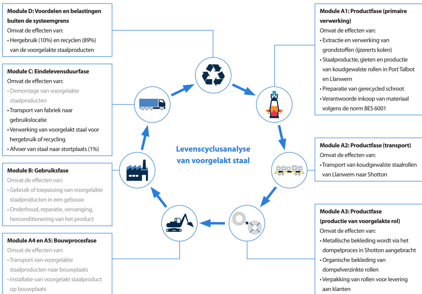
Afbeelding 2 Levenscyclusanalyse van voorgelakt staal

Alle informatie vanuit het dataverzamelingsproces is in aanmerking genomen en betreft alle gebruikte en geregistreerde materialen evenals het totale verbruik van brandstof en energie. De emissies ter plekke zijn gemeten en de metingen zijn verwerkt. De gegevens voor alle relevante productieplaatsen zijn grondig – ook kruiselings – gecontroleerd om potentiële gegevenshiaten in kaart te brengen. Geen enkel proces, materiaal of emissie waarvan een significante bijdrage aan het effect van het voorgelakte staal op het milieu bekend is, is buiten beschouwing gelaten. Op deze basis bestaat er geen bewijs waaruit valt af te leiden dat enige input of output die meer dan 1% bijdraagt aan de totale massa of energie van het systeem, of die milieutechnisch significant is, zou zijn weggelaten. Er wordt ingeschat dat alle uitgesloten stromen minder dan 5% bijdragen aan de effectanalysecategorieën. De productie van de benodigde machines en overige infrastructuur is in de LCA niet in aanmerking genomen.